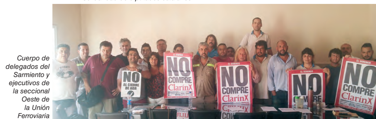
Cuerpo de delegados del Sarmiento y ejecutivos de la seccional Oeste de la Unión Ferroviaria

expresando su apoyo. Los aportes al fondo de lucha también han sido una prioridad en la solidaridad con la lucha. Izquierda Socialista aportó para el fondo de huelga 15 mil pesos e hizo una colecta de más de 5 mil pesos entre los asistentes al acto de Homenaje a Nahuel Moreno el 28 de enero.