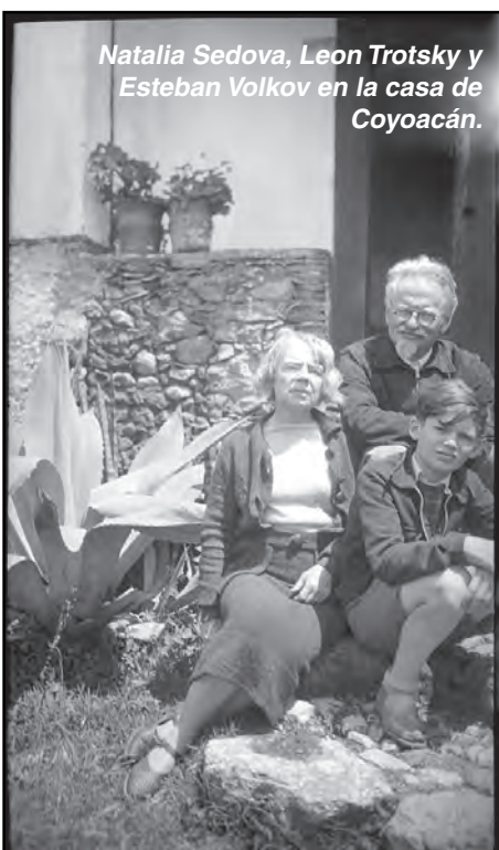
Natalia Sedova, Leon Trotsky y Esteban Volkov en la casa de Coyoacán.

En ella el PTS afirma, textualmente: que "lo esencial de la herencia teórico política (de Moreno) es equivocada". Lo triste es que basan su definición en una larga lista de mentiras. Por ejemplo, dicen que en 1974 hubo una "nueva desviación oportunista de Moreno y el PST". Acusando a Mo-