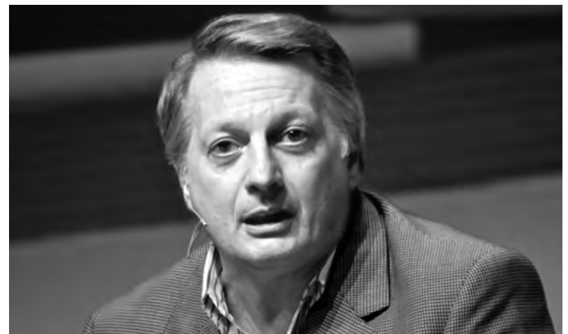
El ministro de Energía Juan José Aranguren

Ahora a todas estas empresas que llevan casi 25 años brindando servicios pésimos, con apagones continuos, burlándose de los usuarios, se las “premia” a cambio de la promesa de reducir los cortes en la próxima década. No sólo se les otorgarán incrementos en las tarifas, sino que continuarán recibiendo cuantiosas sumas en