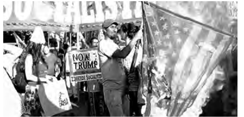
Repudio a Trump frente a la embajada en Buenos Aires

sobre el rol del partido Demócrata como oposición o alternativa e incluso se habla de una posible candidatura futura de Michelle Obama. No debemos olvidar que en los últimos ocho años, con Obama como presidente, se financió a bancos y multinacionales mientras la desigualdad social seguía creciendo y miles de personas perdían sus hogares en medio de la crisis inmobiliaria de 2009.