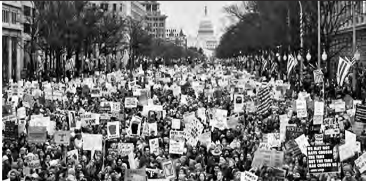
Multitudinaria marcha de mujeres en Washington contra Trump

La brutalidad del nuevo gobierno puede generar falsas expectativas