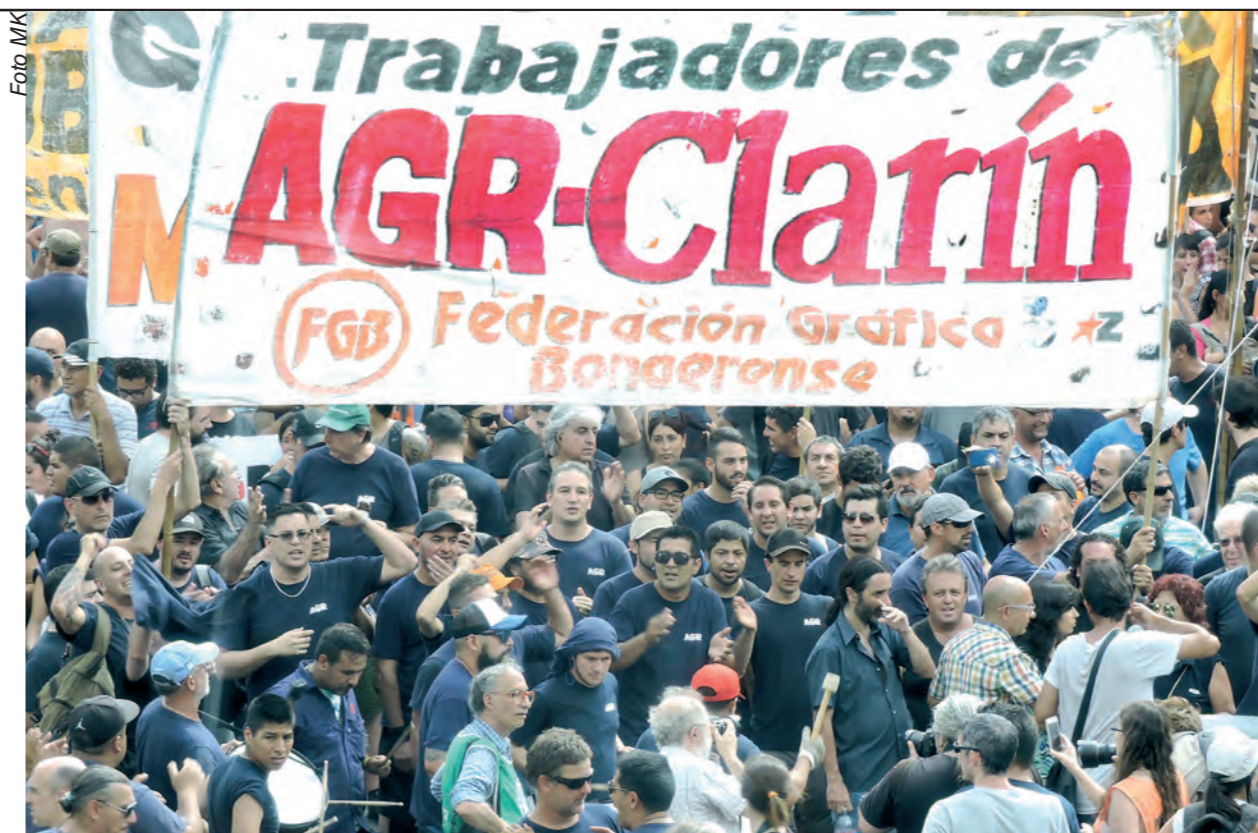
Vista parcial de una de las movilizaciones contra los despidos

el corte del domingo 29 de enero a la madrugada en la gráfica de la calle Zepita, donde se imprime el Clarín, que logró paralizar durante horas el reparto del diario. En este caso, además de los centenares de trabajadores y organizaciones que estuvimos apoyando el piquete, fue fundamental que el sindicato de camioneros decidiera que los choferes no saquen los camiones de reparto de la planta, en solidaridad con los obreros de AGR. Esta importantísima unidad logró frenar la salida del diario hasta media mañana y fortalecer la lucha, haciendo conocer más el conflicto y dándole un golpe al Grupo Clarín.