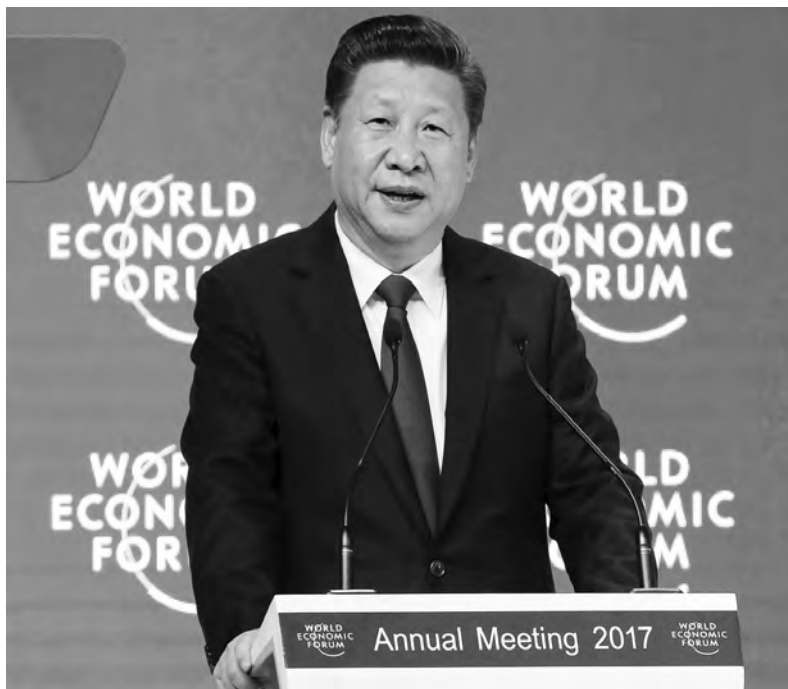
Xi Jinping ahora se presenta como defensor de la globalización

Mientras tanto en Davos el cambio de "escenario económico" se debatía entre una retórica supuestamente "proteccionista" producto de la asunción de Trump y otra de "libre cambio" con Xi Jinping, presidente de China, como abanderado. En el medio se sumaban los debates sobre las consecuencias del Brexit y el futuro de los acuerdos de libre comercio en el mundo. Pero no debemos