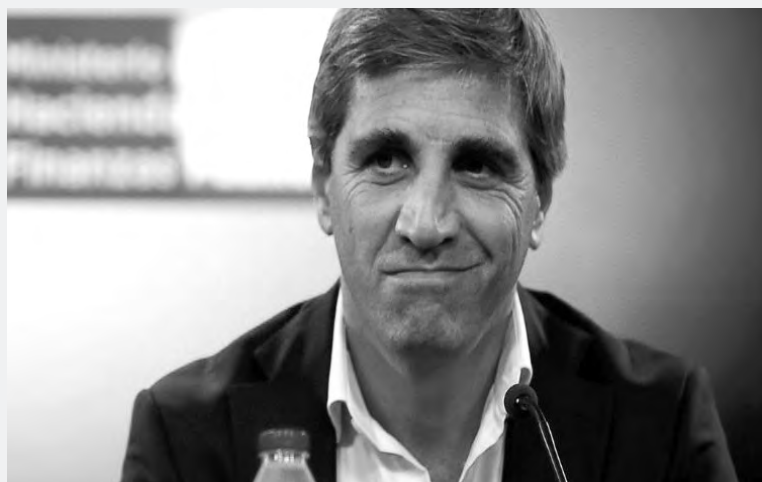
Luis Caputo, ministro de finanzas

La condena contra la CNU es una nueva victoria popular en el camino de la aún pendiente lucha contra la impunidad de todos los genocidas.