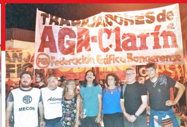
Dirigentes sindicales y políticos de Izquierda Socialista y de la UIT-CI en apoyo