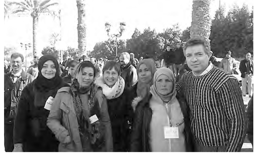
Junto a luchadoras tunecinas