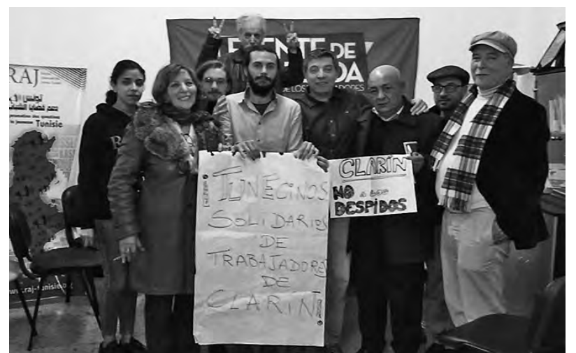
Solidaridad con los trabajadores de AGR-Clarín desde Túnez

interés sobre la lucha argentina contra el pago de la deuda como ejemplo para el caso tunecino, y también se conversó acerca de la problemática de la organización y dirección revolucionarias en el país. Para