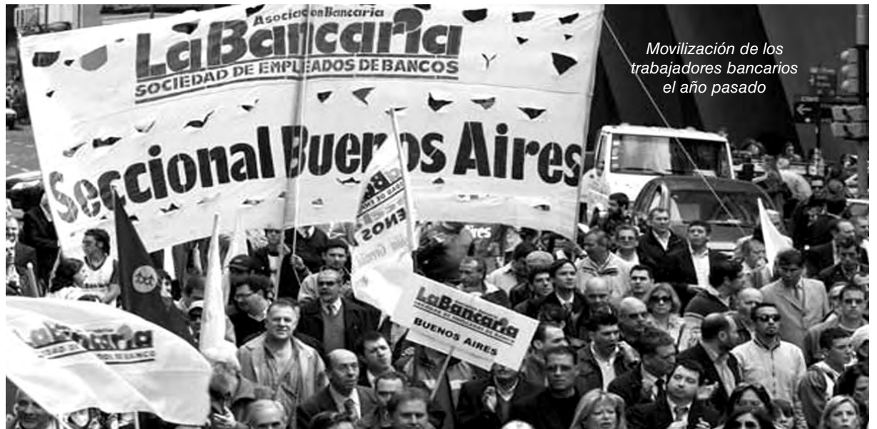
Movilización de los trabajadores bancarios el año pasado

Las intenciones del gobierno son clarísimas: que los trabajadores suframos la pérdida salarial de entre 10 y 15% de 2016 y que la pauta salarial de este año no pase el 17%. Aducen que la inflación “no pasará” esa cifra, cuando los propios economistas del establishment calculan que será mayor al 25% y todos los aumentos ya preanuncian un número mayor. Se vienen durísimas peleas por el salario, como lo anticipan los trabajadores bancarios y los docentes de todo el país. Este es el desafío que deberemos enfrentar, discutiendo democráticamente en asambleas y coordinando al sindicalismo combativo, mientras exigimos a las direcciones de la CGT que rompan la tregua y convoquen urgentemente a medidas de lucha contra el gobierno.